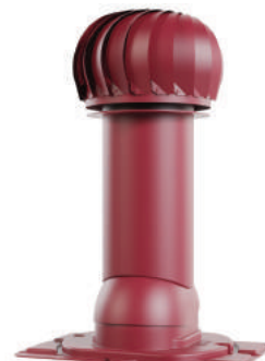
с универсальным проходным элементом