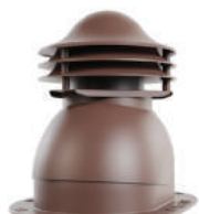
для готовой мягкой и фальцевой кровли