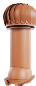
для монтажа на профлист 20, 21 мм