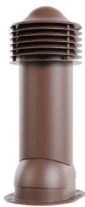
для готовой мягкой и фальцевой кровли