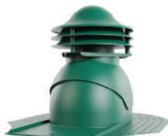
для мягкой кровли при монтаже