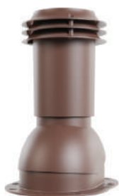
для готовой мягкой и фальцевой кровли