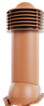
для монтажа на профлист 20, 21 мм