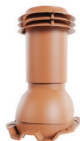
для монтажа на профлист 20, 21 мм