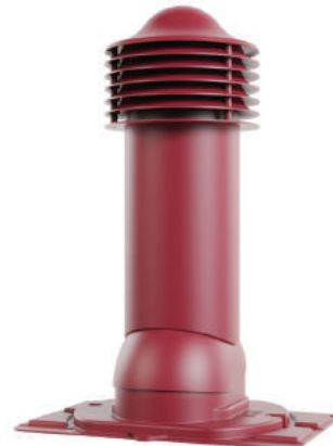
с универсальным проходным элементом