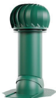
для мягкой кровли при монтаже