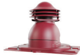
с универсальным проходным элементом