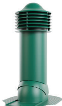
для мягкой кровли при монтаже