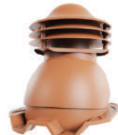
для монтажа на профлист 20, 21 мм