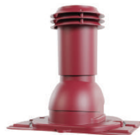
с универсальным проходным элементом