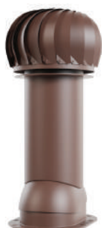
для готовой мягкой и фальцевой кровли