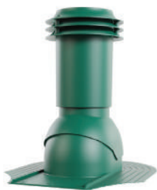
для мягкой кровли при монтаже