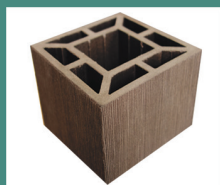
Столб большой 3050 x 120 x 120 мм