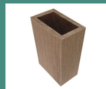
Балюстрада 2400 x 50 x 30 мм