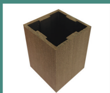
Столб малый 3050 x 70 x 70 мм