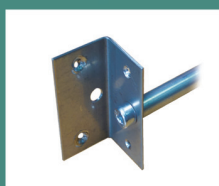
Уголок большой с втулкой 70 x 35 x 35 мм