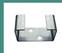
Крепление балюстрады 40 x 20 x 24 мм