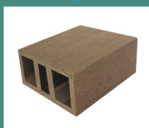
Подбалюстенник 2400 x 70 x 35 мм