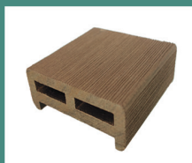
Перила 2400 x 86 x 31 мм