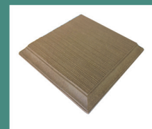
Крышка 130 x 130 мм