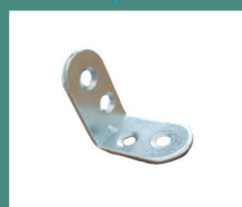
Малый уголок 16 x 30 x 30 мм